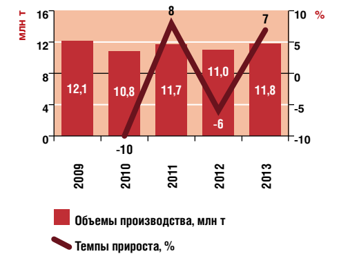
Рисунок 2. ДИНАМИКА ПРОИЗВОДСТВА ЯБЛОК В СТРАНАХ ЕВРОСОЮЗА в 2009–2013 годах, млн т

Тем не менее, несмотря на очевидные сложности в организации логистической системы прямого импорта, большинство экспертов склонны считать этот подход перспективным для крупных розничных сетей,